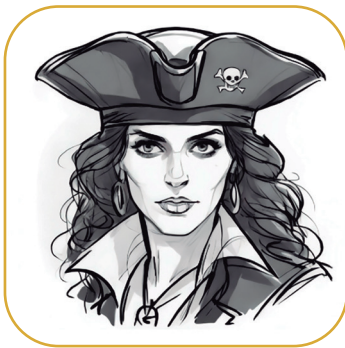
CAPITANA ISABELLA "Ojo de Tigre"

Intrépida y sagaz, la Capitana Isabella se destaca por su incomparable habilidad en la batalla y una percepción que le ha dado su apodo de "Ojo de Tigre". Rumores insisten en que es la descendencia no reconocida del Capitán Black, aunque nadie lo ha confirmado. Isabella es una líder feroz, capaz de guiar a su tripulación con valentía, siempre en busca de la victoria, pero con un espíritu de lucha que oculta una búsqueda más personal.